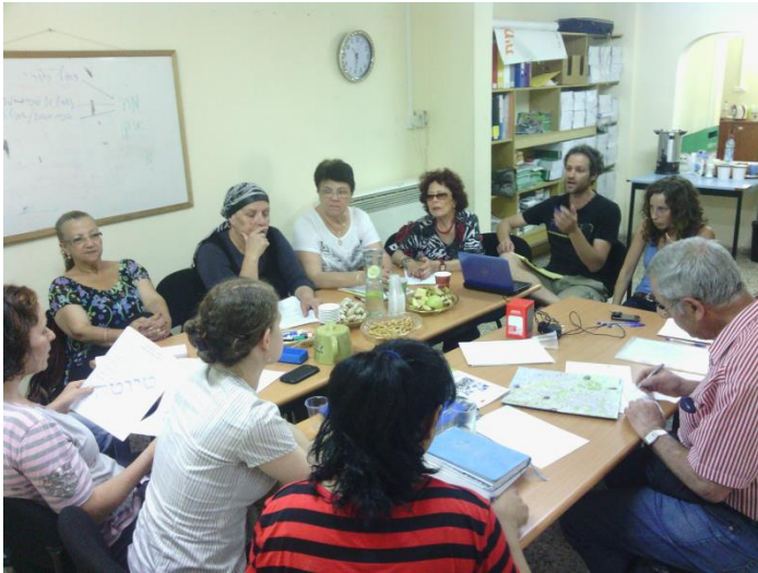
מפגש פעילים בהשתתפות תחבורה היום ומחר, במרכז לעבודה קהילתית, חיפה

▶ בעקבות פעילות קבוצת 'צעירי כפר קרע לשינוי', מקדמת עיריית כפר קרע קו פנימי ביישוב, מול משרד התחבורה.