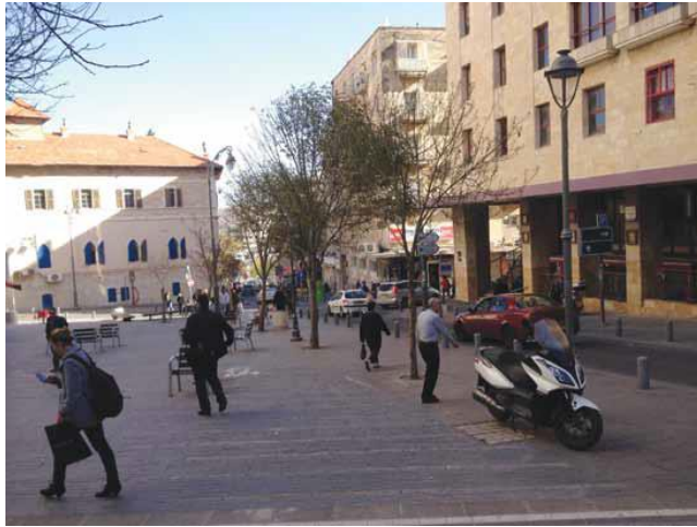
רח' הילל, ירושלים