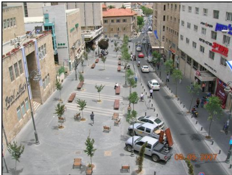
מדרחוב ומיתון תנועה במרכז העיר ירושלים (רח' הלל)

▶ תכנון, צפיפות ואופי בינוי מותאמים לתחבורה ציבורית בהתחדשות עירונית, שכונות חדשות ואזורי תעסוקה.