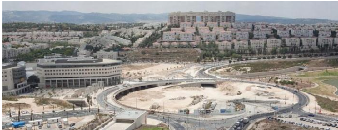
ככר התחבורה במרכז העיר, מודיעין