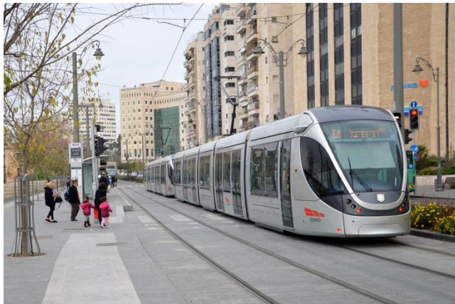
רכבת קלה ברח' יפו, ירושלים

▶ תכנית מתאר מקומית לחנייה ובה תקן חנייה מופחת המגביל מאוד את היצע החנייה במרכז העיר.