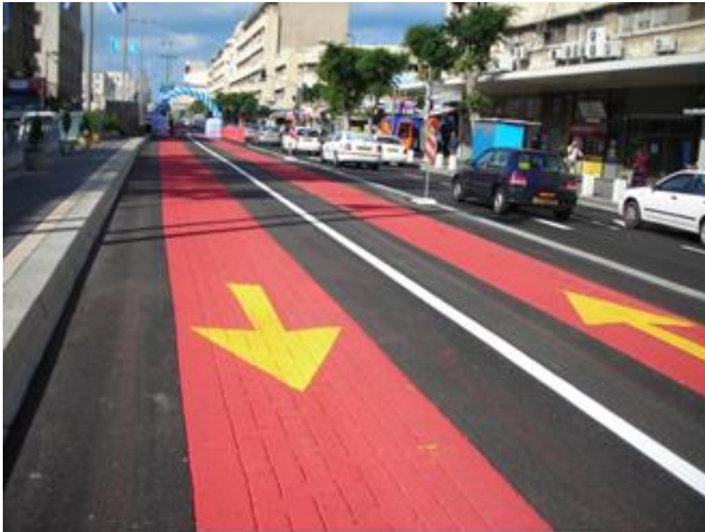
תוואי המטרונית ברחוב העצמאות בחיפה

קידום תשתיות תומכות תחבורה ציבורית כגון מדרכות רחבות, מפרצים הפוכים לתחנות אוטובוס, המרת נתיבים לנתיבי תחבורה ציבורית ועוד.