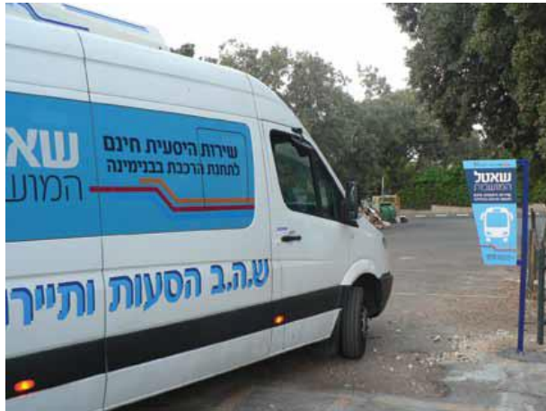
השאטל מגבעת עדה לרכבת בנימינה, שהתבטל