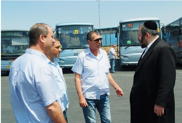
ראש עיריית ביתר עלית עם נהגי חברת עלית