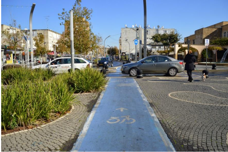
שביל אופניים, הרצליה

▶ פיתוח שבילי אופניים - השקעת תקציב שנתי בגובה של כ - 3-4 מיליון ש"ח בפיתוח שבילי אופניים ברחבי העיר. ברחבי העיר סלולים עד כה 12.4 ק"מ שבילי אופניים. סך אורך כל שבילי האופניים המתוכננים במסגרת תכנית האב לשבילי אופניים בעיר עומד על 34.8 ק"מ.