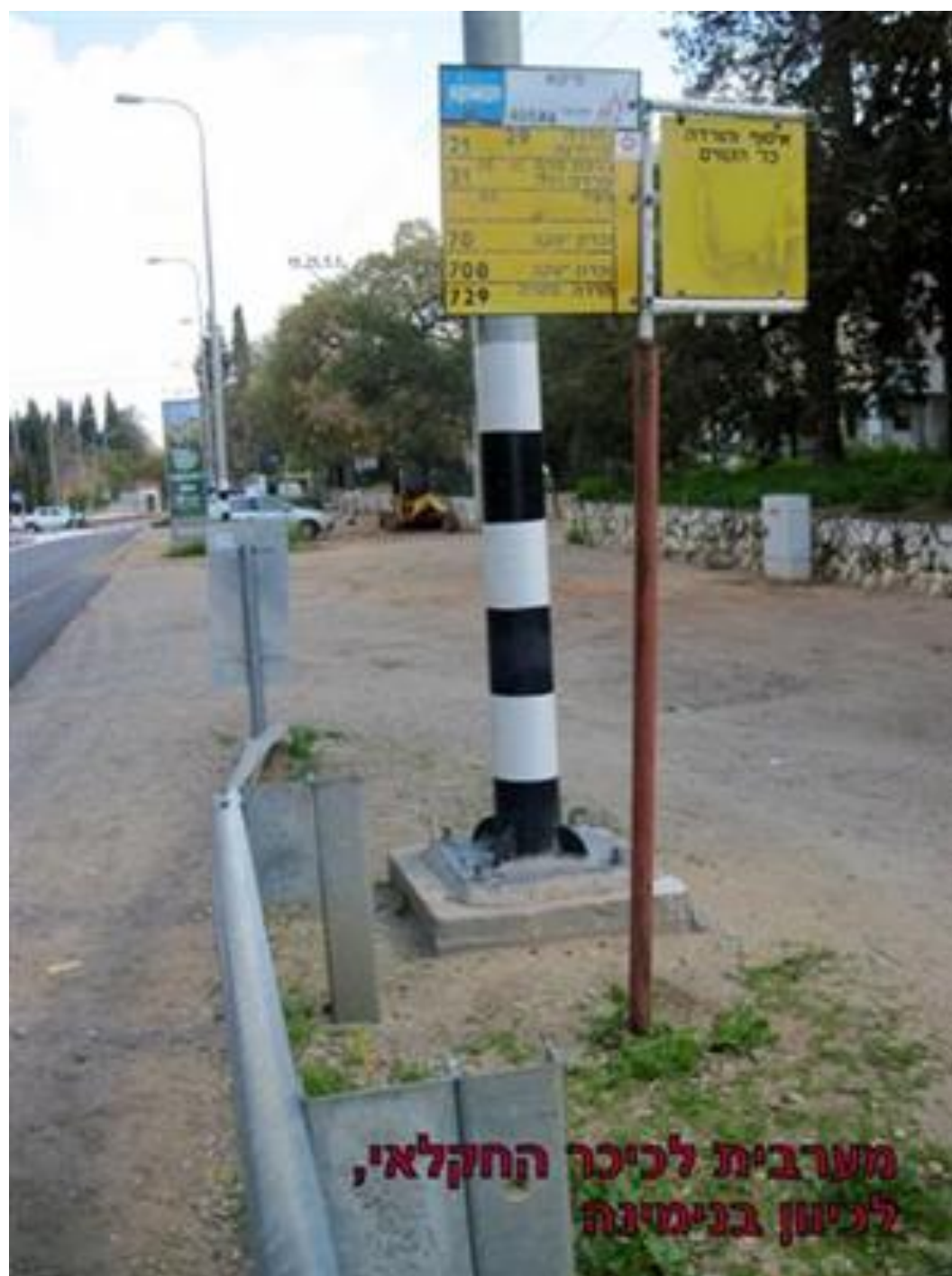
מערבית לכיכר החקלאי, לניוון בנימינה