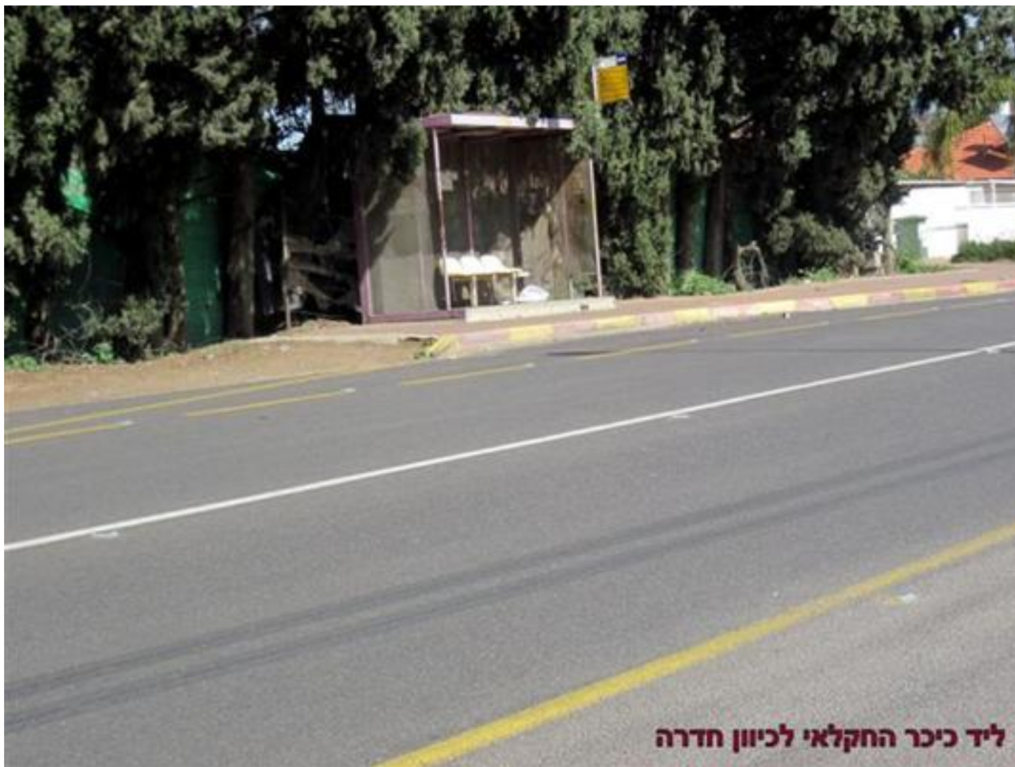
ליד כיכר החקלאי לכיוון חדרה