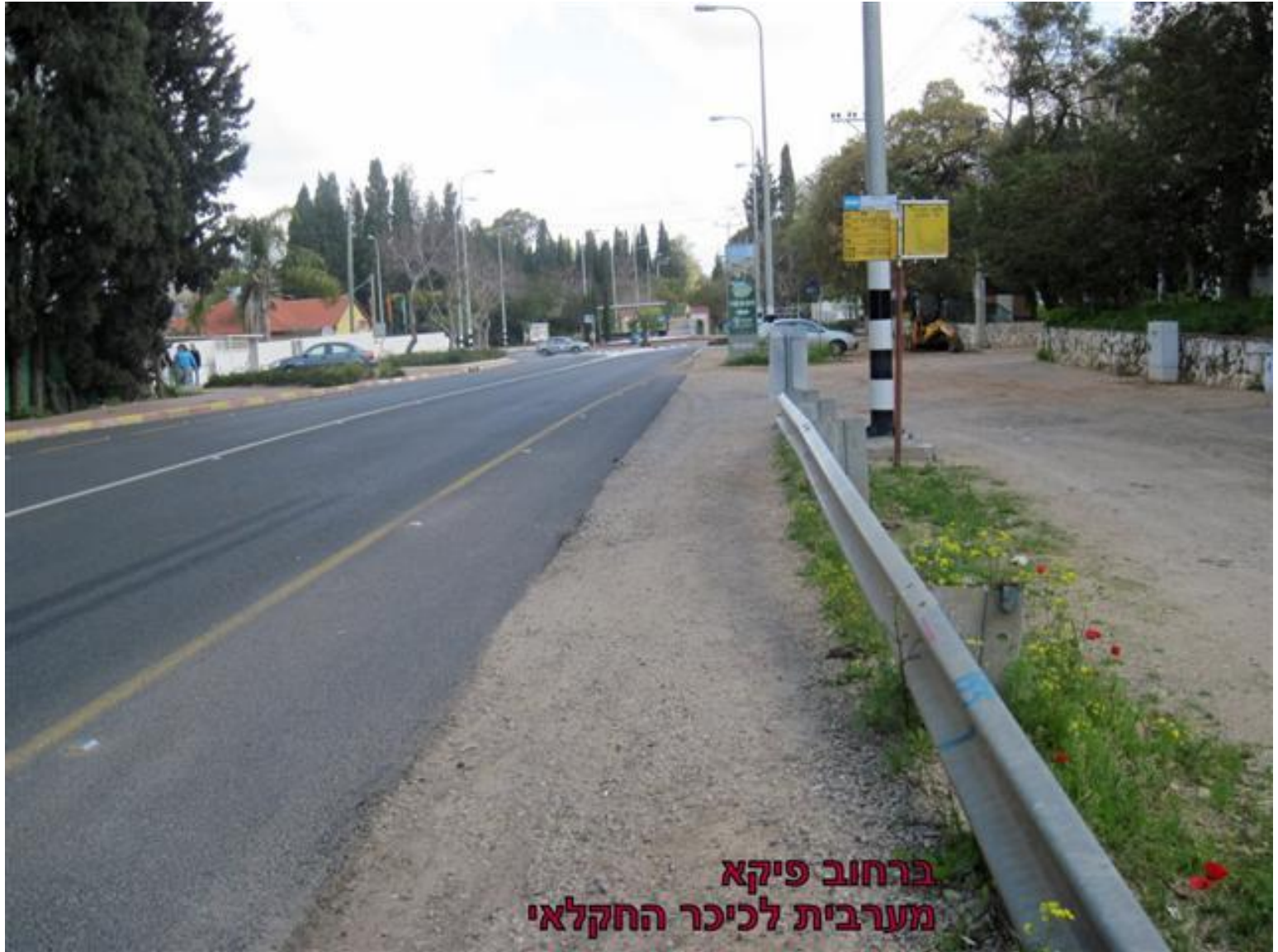
ברחוב פיקא מערבית לכיכר החקלאי