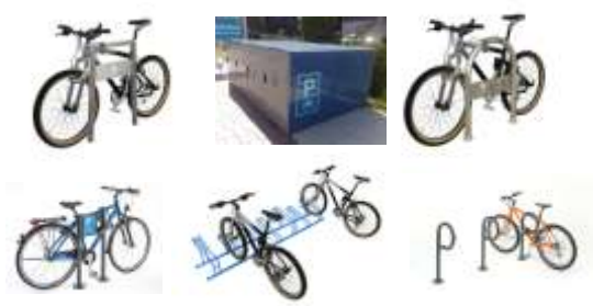
מוצרים נוספים ניתן לראות באתר האינטרנט של החברה www.chanofan.com