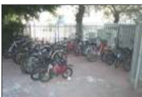
ביה"ס גורדון, תל אביב