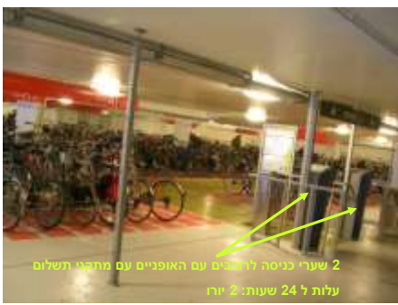
2 שערי כניסה הרחבים עם האופניים עם תחבובת חסלום עלות ל 24 שעות: 2 יורו