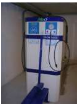
בפינת החניון קיים מתקן לניפוח גלגלים