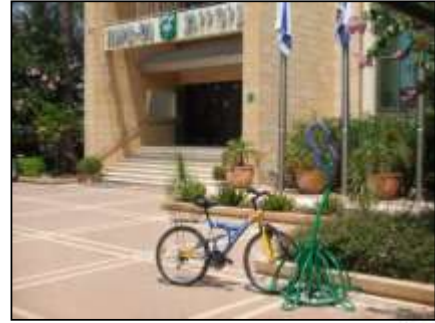
דגם אירוס הגלבוץ, עיצוב בלעדי לעיריית נס ציונה