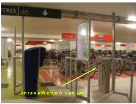
שער מעבר לרוכבים ללא אופניים