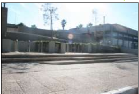
מוזיאון ארץ ישראל, תל אביב