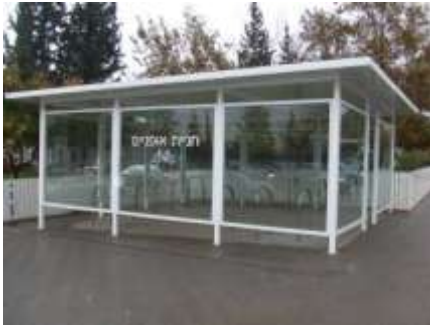
משרדי בנק לאומי - לוד