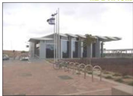
תחנת רכבת להבים