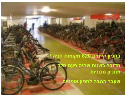
בחניון קיימים 820 מקומות חניה! מדובר בשטח שהיה פעם חלק מחניון מכוניות שעבר הסבה לחניון אופניים