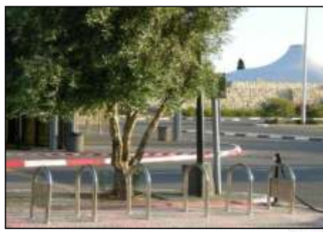
מוזיאון ישראל, ירושלים