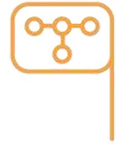
הוספת תחנות חדישות ודיגיטליות