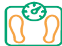
שמירה על כושר