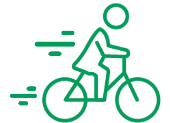
חוצה את גוש דן