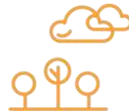
שדרוג המרחב העירוני

תקציב הפרויקט במגזר העירוני כ- 3.5 מיליארד ₪