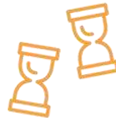
הגברת תדירות האוטובוסים